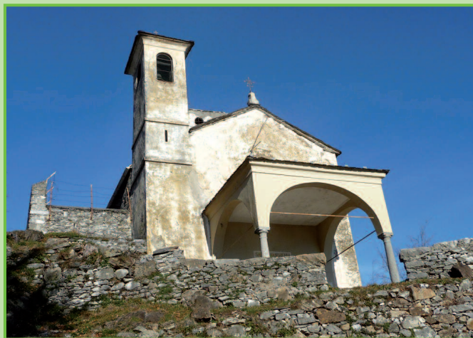
Chiesa di S. Eufemia

primo bivio si lascia la mulattiera in salita e si scende a destra entrando in una valle che si attraversa su una passerella. Si risale l'altro versante della valle per poi scendere lungo un sentierino che raggiunge la strada. La si segue a destra aggirando il paese di Cosio 307 m passando sopra la chiesa della Madonna della Neve. Si supera il tornante e appena dopo un piccolo parcheggio si gira a sinistra imboccando il sentierino che supera due piccole valli. Il sentiero sbuca sull'asfalto e si attraversa la