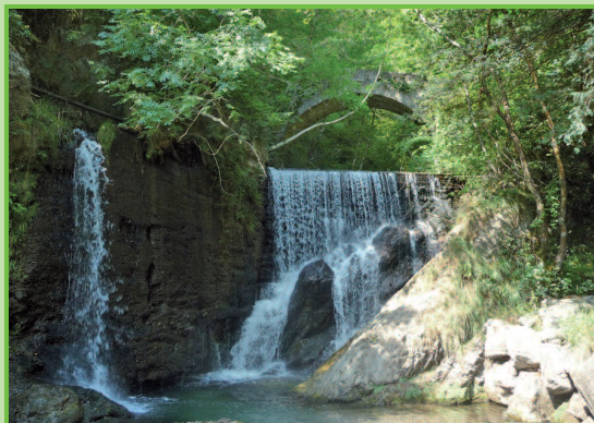
Cascata di Tobi

(Mappa 1) Siamo su un tratto dell'ex ferrovia Menaggio Porlezza, trasformata grazie alla Comunità Montana locale in una