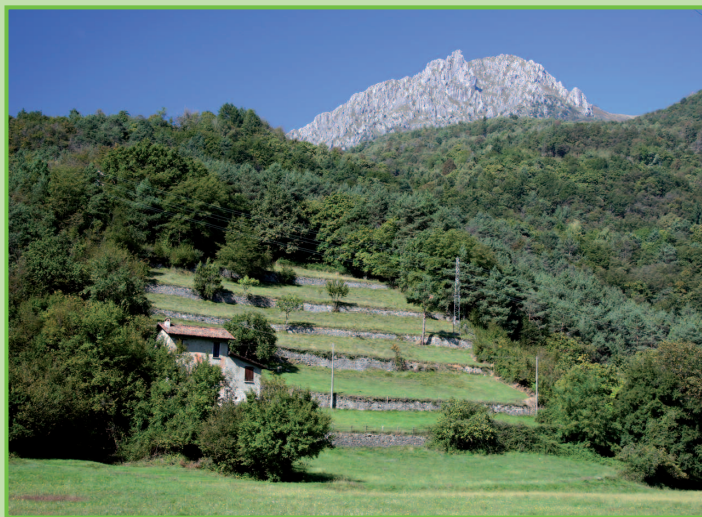
Località Piamuro

Ci troviamo nella frazione Loveno, una località storicamente meta di soggiorno per famiglie patrizie che vi edificarono importanti dimore. È il caso di villa Bel Faggio sulla sinistra appena imboccata la via, e avanti 200 m di Villa Garovaglio, e di Villa Mylius Vigoni di proprietà della Repubblica Federale della Germania, ora sede del centro culturale italo tedesco Villa Vigoni, che organizza convegni ad alto livello. La villa e il suo