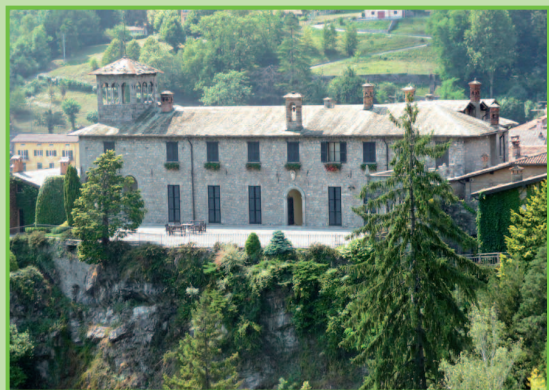
Villa Bagatti Valsecchi

parco sono visitabili su prenotazione (tel. 0344 361232). Si passa davanti alla chiesa di San Lorenzo con la sua facciata barocca e al Centro Sportivo per poi arrivare alla località Piamuro (40 min.), un grande pascolo dove ha anche inizio il Parco Val Sanagra.