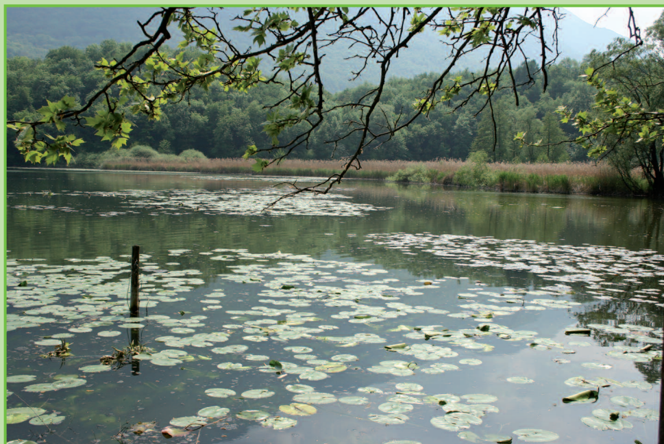
Lago di Piano

Proseguendo sulla pista ciclabile si attraversa un bel ponte di legno sul fiume Cuccio. Si segue il corso del fiume fino a incrociare la strada provinciale Sp14. Si prosegue a destra per ca. 100 metri, quindi bisogna attraversare la strada ed imboccare Via Prati che conduce al complesso residenziale di Porto Letizia. Sul lato sinistro dell'edificio principale del complesso riprende la pista ciclabile che costeggia il lago. Superato il ponticello sul fiume Val Rezzo, si scendono alcuni gradini per proseguire sul lungo lago di Porlezza fino alla fermata dell'autobus C12.