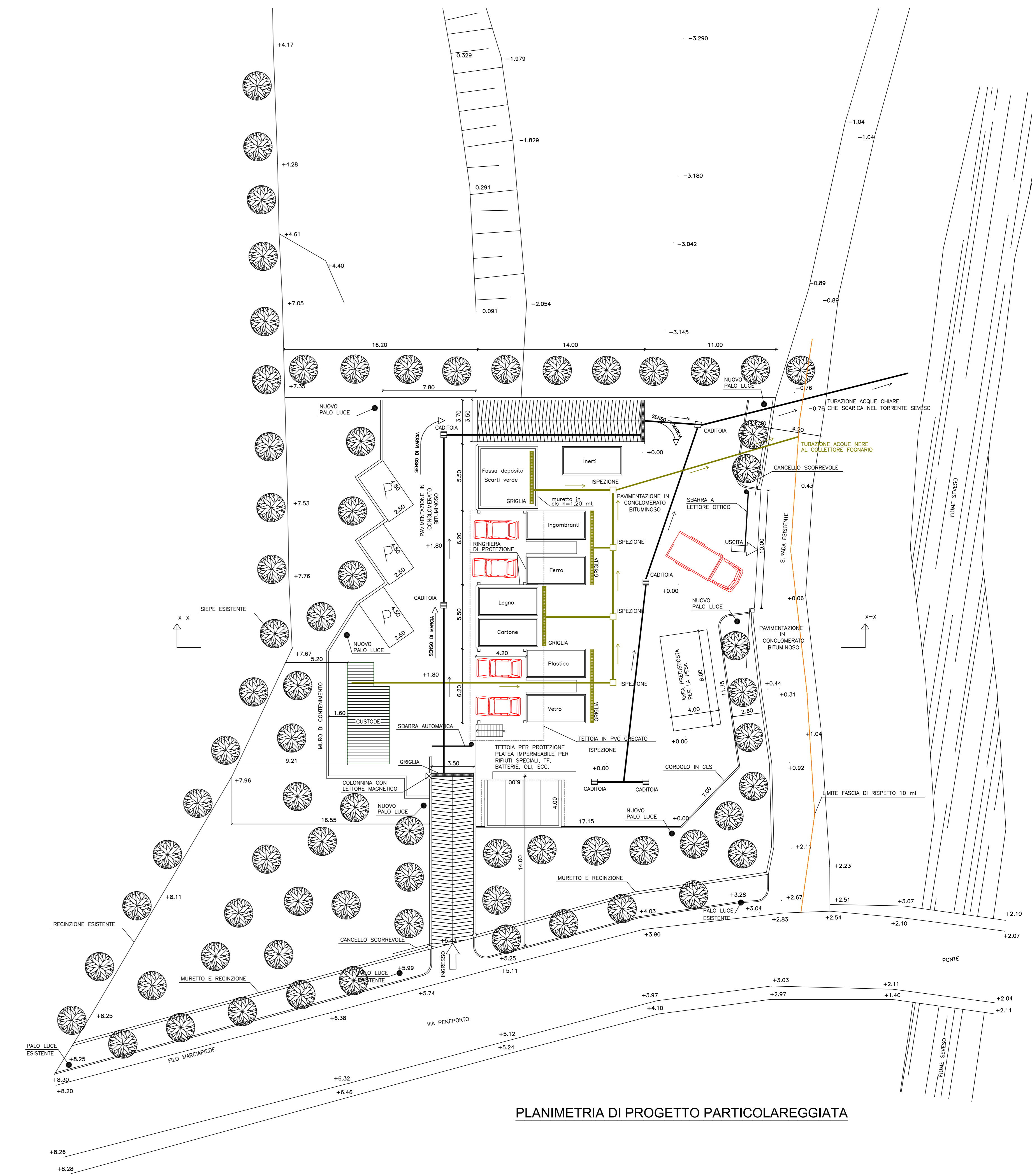
PLANIMETRIA DI PROGETTO PARTICOLAREGGIATA